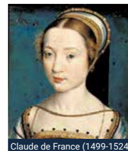
Claude de France (1499-1524)

Pourquoi évoquer en 2024 cet événement essentiel de l'histoire de Bretagne que fut son annexion par la France en août 1532 ?