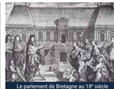
Le parlement de Bretagne au 18 e siècle

Le 30 juillet 1524 : décès de la reine Claude, dernière duchesse de Bretagne et épouse du roi de France François 1 er . Outre le fait d'avoir laissé son nom à une prune, la reine Claude est célèbre pour avoir renoncé à tous ses droits sur le Duché de Bretagne, au profit de son mari.