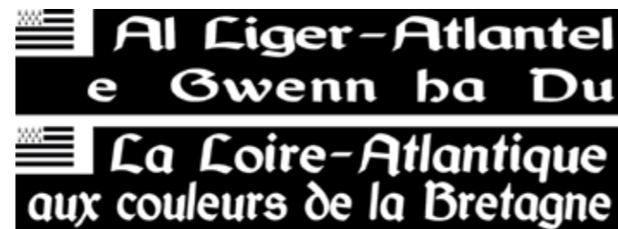
Communes arborant au moins un Gwenn ha Du visible depuis l'espace public.

Membre du comité local du pays de Lorient, chargé de l'opération « La Loire-Atlantique aux couleurs de la Bretagne »